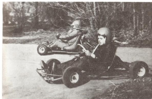
Картингисты заводского клуба юных техников

Один этаж был отдан клубу юных техников, где картингисты сами конструировали и мастерили свои гоночные машины, а другие ребята увлеченно делали авиамodelи и копии космических кораблей, юные радиотехники изготавливали интересные электронные приборы и действующие модели, управляемые по радио. Юные фотографы участвовали в выставках и снимали короткометражные фильмы.